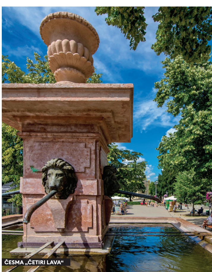
ČESMA „ČETIRI LAVA“