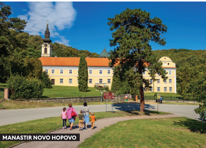
MANASTIR NOVO HOPOVO

Sremski Karlovci su oko 80 km udaljeni od Beograda, i svega 11 km od Novog Sada.