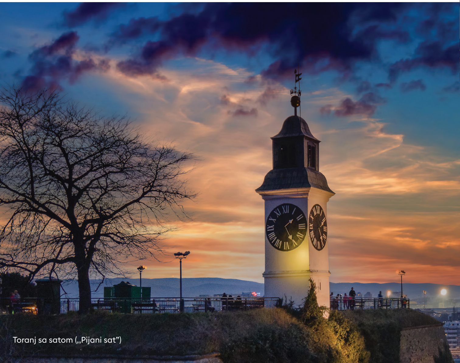
Toranj sa satom („Pijani sat“)

dostupan je posetiocima uz stručno vođenje Vodičke službe Muzeja grada Novog Sada. Ova ustanova kulture se nalazi u zgradi Arsenala – Topovnjače, na Gornjoj tvrđavi i posetiocima pruža uvid u način života i kulturu stanovanja Novosađana u periodu od XVIII do XX veka. U sklopu muzeja je i Veliki ratni bunar, remek-delo arhitekture i građevinarstva, koji je, u slučaju velike opsade, mogao celu tvrđavu da snabdeva pitkom vodom.