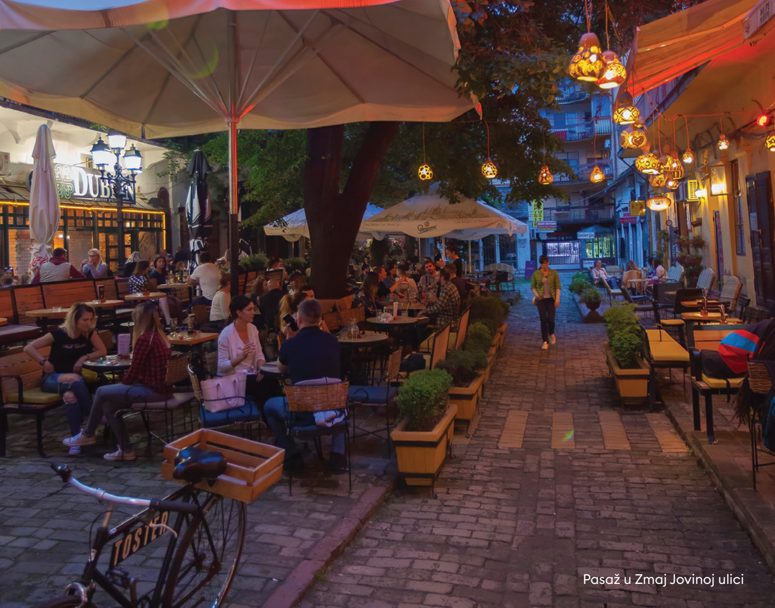
Pasaž u Zmaj Jovinoj ulici