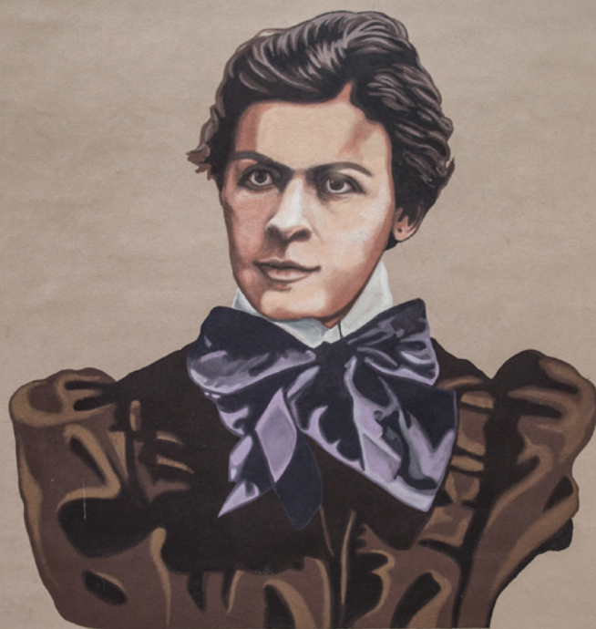
Милева Марић - Ајнштајн

koja i danas privlači turiste. U Muzeju grada Novog Sada na Petrovaradinskoj tvrđavi, postavljena je multimedijalna izložba „Mileva: mi smo stena“ kojom su dočarani različiti elementi biografije ove znamenite žene. Ova nesvakidašnja izložba predstavlja spoj kreativne upotrebe najmodernijih tehnologija, novih medija, ali i klasičnog umetničkog jezika. Postavka „Mileva“ na autentičan način upoznaje posetioce sa životnom pričom žene koja je istovremeno bila vrsna matematičarka, marginalizovana naučnica, požrtvovana majka, kao i supruga jednog od najvećih svetskih umova.