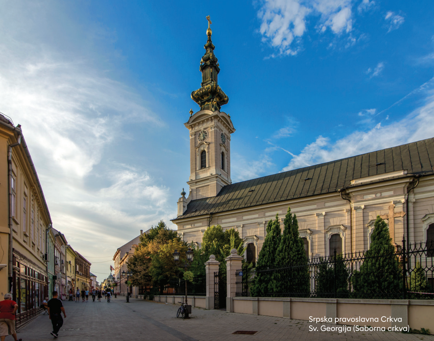
Srpska pravoslavna Crkva Sv. Georgija (Saborna crkva)