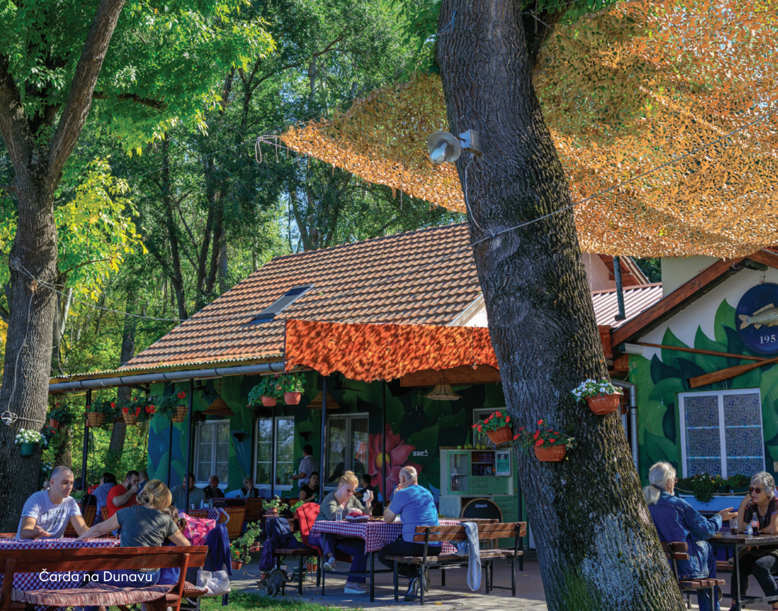
Čarda na Dunavu