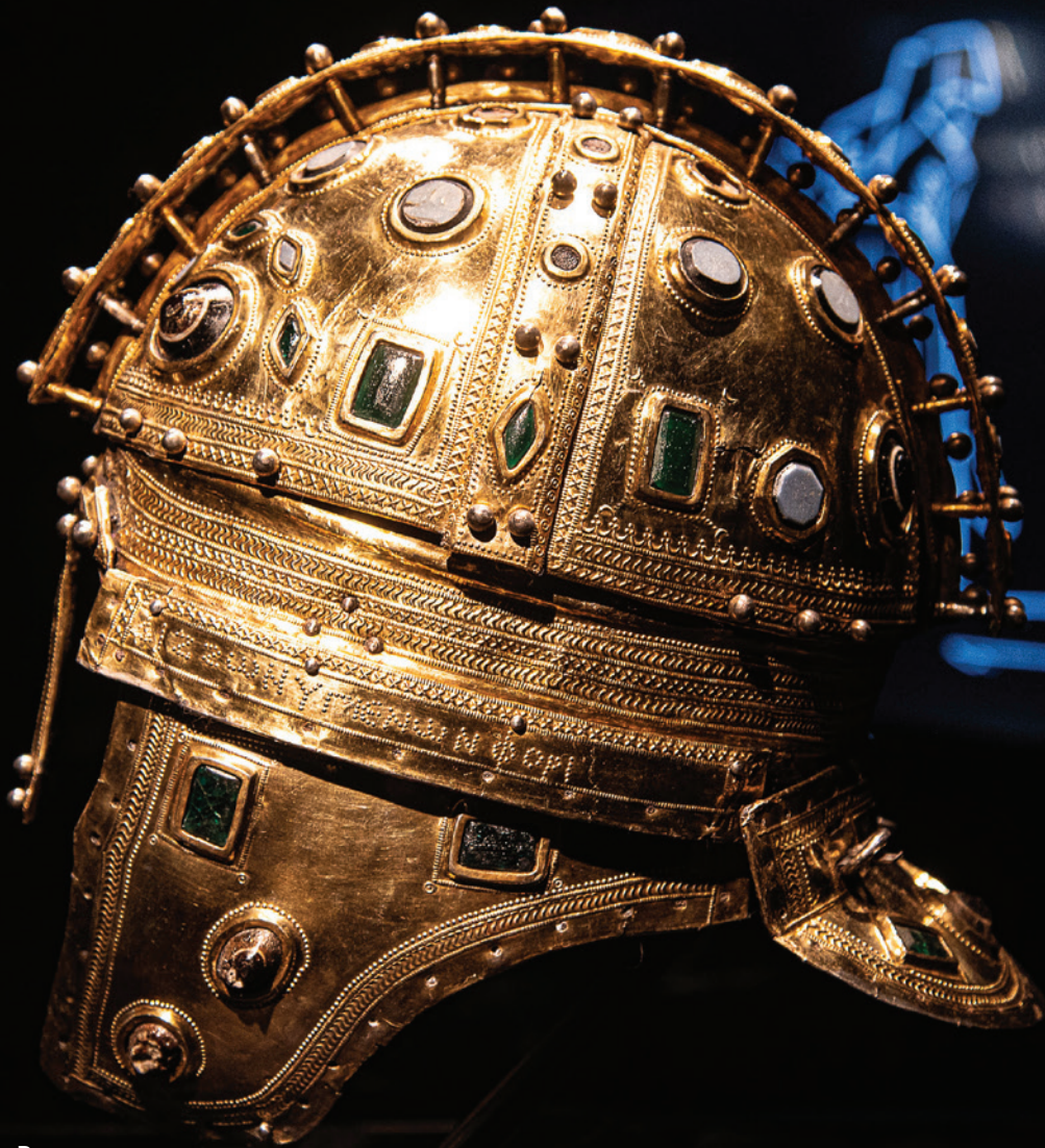
Музеј Војводине - Римски шлем