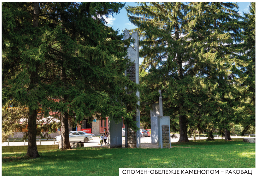
СПОМЕН-ОБЕЛЕЖЈЕ КАМЕНОЛОМ – РАКОВАЦ

Споменици НОБ-а у невеликом фрушкогорском селу, Раковац су парадигма оружане борбе против усташа и Немаца и страдања народа током одмазде фашиста. Спомен-обележје Каменолом подигнут је на месту где су „мештани Раковца и родници Каменолома сврстани у две борбене десетине” и септембра 1941. положили Партизанску заклетву. Текст заклетве исписан је у унутрашњости споменика, а имена погинулих партизанских бораца сврстана на једној табли, као и имена побијених Раковчана на две табле, одмах до централног споменика, сведоче