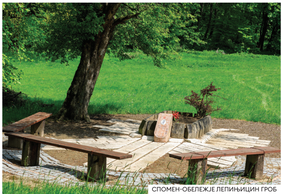
СПОМЕН-ОБЕЛЕЖЈЕ ЛЕПИЊИЦИН ГРОБ

За народног хероја проглашен је још 1943. а његови посмртни остаци су пренети на Спомен гробље у Сремској Митровци. У близини Широких ледина на месту његове погибије данас је спомен-обележје које ретко ко може пронаћи.