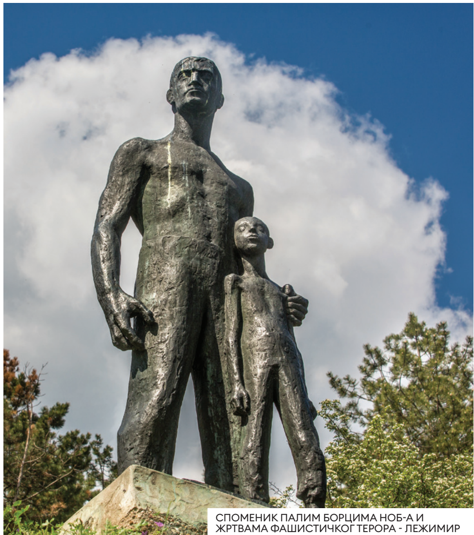
СПОМЕНИК ПАЛИМ БОРЦИМА НОБ-А И ЖРТВАМА ФАШИСТИЧКОГ ТЕРОРА - ЛЕЖИМИР