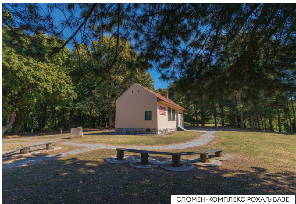
СПОМЕН-КОМПЛЕКС РОХАЉ БАЗЕ

Ту су се налазиле житне базе, пекара, кланица, радионице за поправку оружја и оруђа, база за опоравак ранењика и бораца и повремено седиште Штаба Народноослободилачких партизанских одреда Срема. Одавде су полазили транспорти за снабдевање војвођанских партизанских јединица које су прешле у Босну.