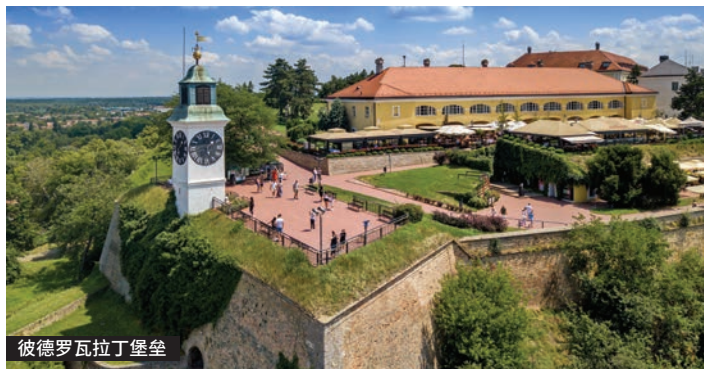
彼得罗瓦拉丁堡垒

是欧洲最大、保存最完好、设计最复杂的要塞之一。彼得罗瓦拉丁要塞修建于1692年至1780年间，从未被外敌攻破，享有“多瑙河直布罗陀”的美誉。要塞由上下城 (Podgrađe) 组成。上城的主题是一个钟楼，大指针显示小时，小指针显