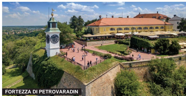
FORTEZZA DI PETROVARADIN

7. FORTEZZA DI PETROVARADIN È una delle fortezze più grandi, meglio conservate e più complesse d'Europa. Mai conquistata, la Fortezza di Petrovaradin - "la Gibilterra del Danubio", è stata costruita tra il 1692 e il 1780. La Fortezza è composta dalla Città Alta e quella Bassa (Suburbio). La Città Alta è dominata dalla Torre con l'orologio la cui lancetta grande indica le ore mentre quella piccola indica i minuti. Le gallerie sotterranee militari a