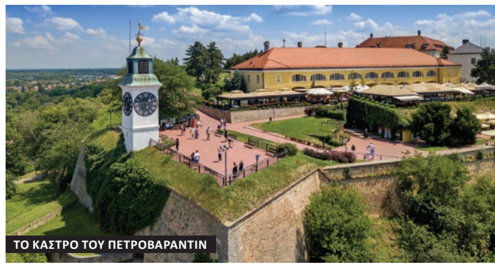
ΤΟ ΚΑΣΤΡΟ ΤΟΥ ΠΕΤΡΟΒΑΡΑΝΤΙΝ

16 χιλόμετρων και είναι μοναδικό αξιοθέατο του κάστρου του Πετροβαραντίν. Εντός του μουσείου της πόλης του Νόβι Σαντ, στους επισκέπτες του είναι διαθέσιμες και οι επαγγελματικές υπηρεσίες ξενάγησης.