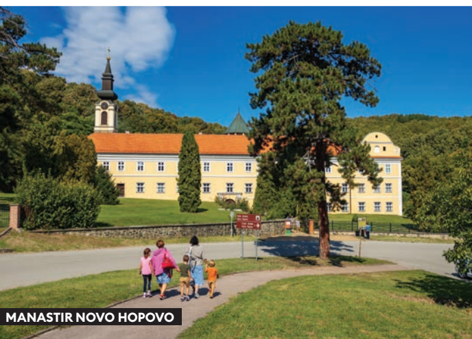
MANASTIR NOVO HOPOVO

Sremski Karlovci su oko 80 km udaljeni od Beograda, i svega 11 km od Novog Sada.