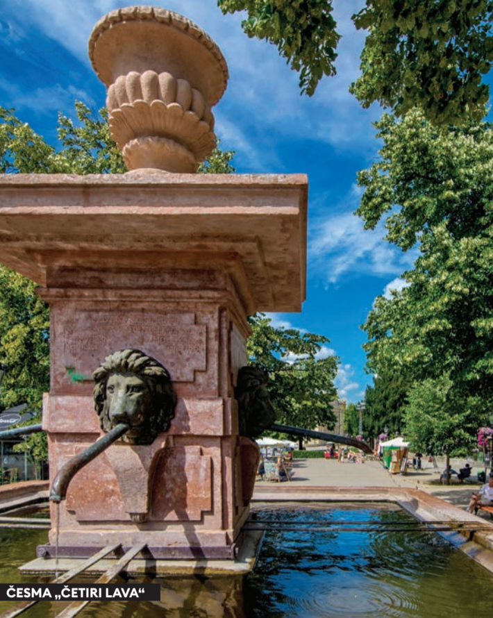
ČESMA „ČETIRI LAVA“