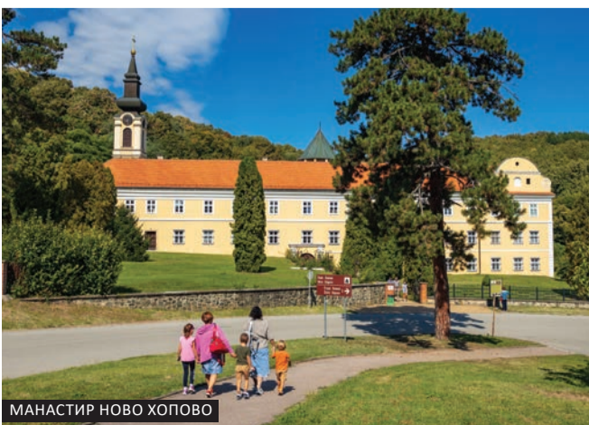
МАНАСТИР НОВО ХОПОВО

Сремски Карловци су око 80 км удаљени од Београда, и свега 11 км од Новог Сада.