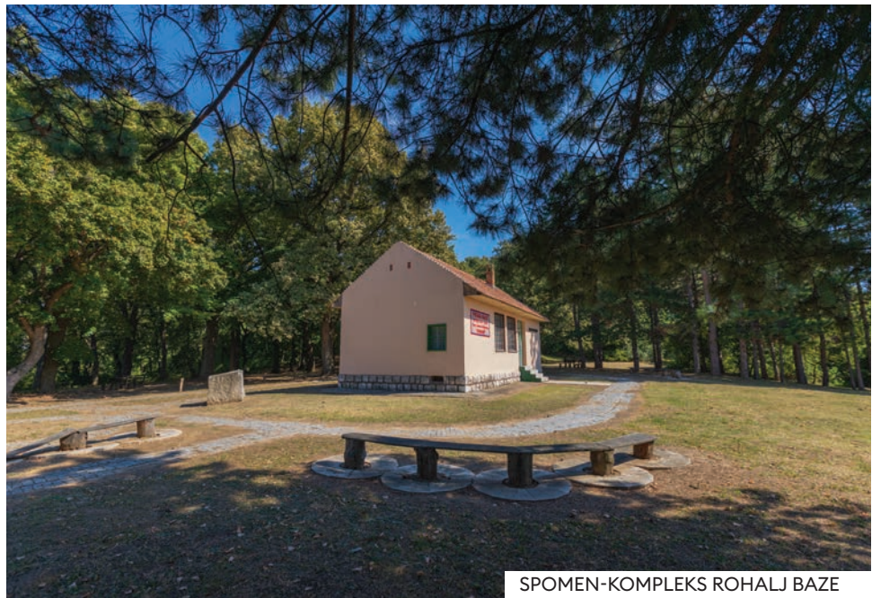
SPOMEN-KOMPLEKS ROHALJ BAZE

Do Drugog svetskog rata tu se nalazio zaselak Stari Divoš gde je živelo dvadesetak rusinskih porodica, a prema prezimenu jedne od njih, u čijoj kući su partizani boravili, prostor je nazvan Rohalj baze. Već u jesen 1941. ovde je bio siguran prostor za partizanske borce i narod Fruške gore. Tu su se nalazile žitne baze, pekara, klanica, radionice za popravku oružja i oruđa, baza za oporavak ranjenika i boraci i povremeno sedište Štaba Narodnooslobodilačkih partizanskih odreda Srema. Odavde su polazili transporti za snabdevanje vojvodanskih partizanskih jedinica koje su prešle u Bosnu.