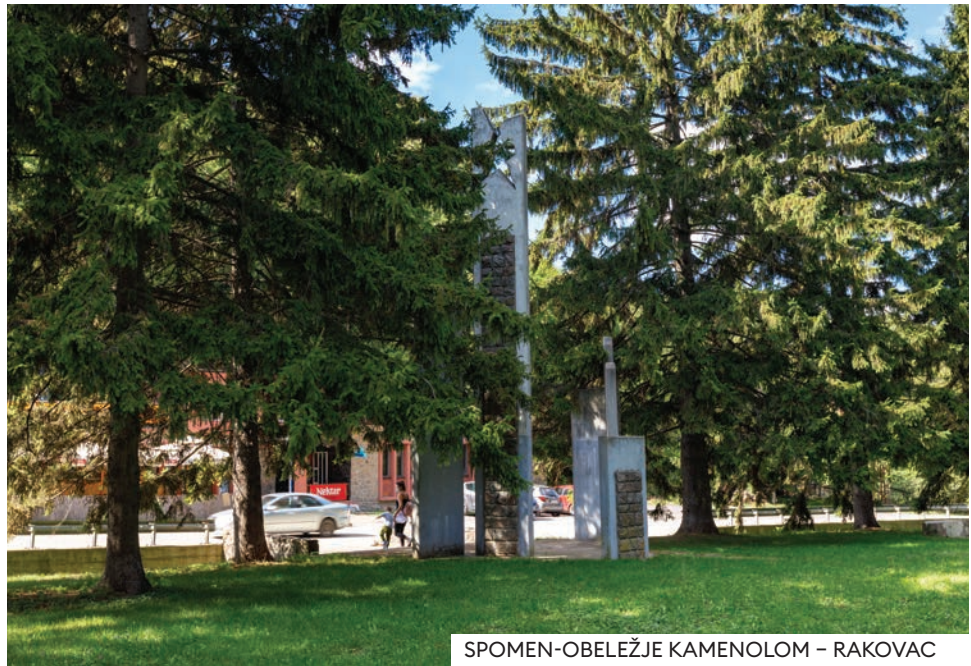
SPOMEN-OBELEŽJE KAMENOLOM – RAKOVAC

Spomenici NOB-a u nevelikom frušogorskom selu, Rakovac su paradigma oružane borbe protiv ustaša i Nemaca i stradanja naroda tokom odmazde fašista. Spomen-obeležje Kamenolom podignut je na mestu gde su „meštani Rakovca i radnici Kamenoloma svrstani u dve borbene desetine“ u septembru 1941. položili Partizansku zakletvu. Tekst zakletve ispisan je u unutrašnjosti spomenika, a imena poginulih