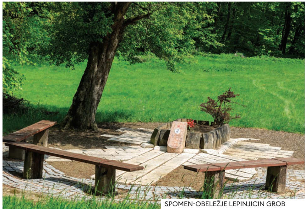
SPOMEN-OBELEŽJE LEPINJICIN GROB

Za narodnog heroja proglašen je još 1943. a njegovi posmrtni ostaci su preneti na Spomen groblje u Sremskoj Mitrovici. U blizini Širokih ledina na mestu njegove pogibije danas je spomen-obeležje koje retko ko može pronaći.