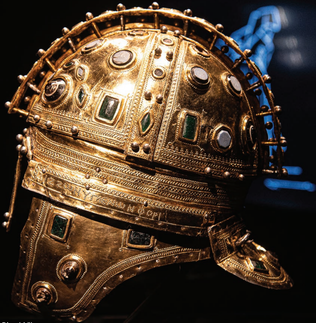
Muzej Vojvodine - Rimski šlem