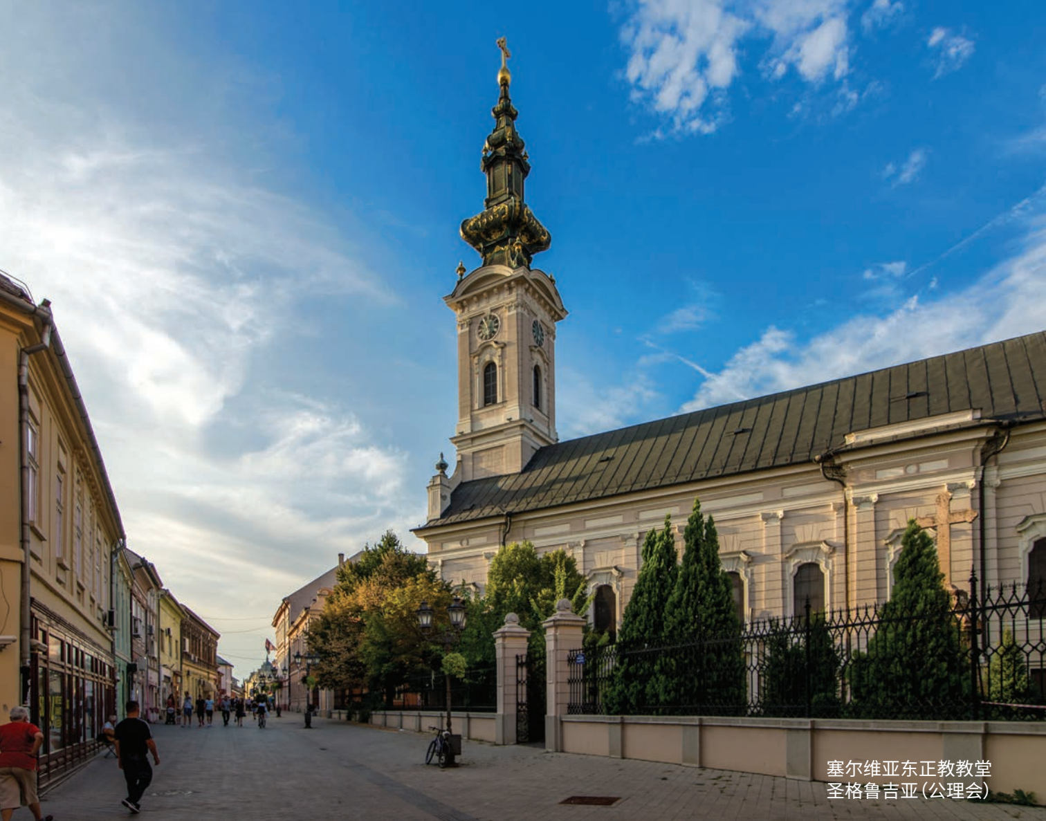
塞尔维亚东正教教堂 圣格鲁吉亚(公理会)