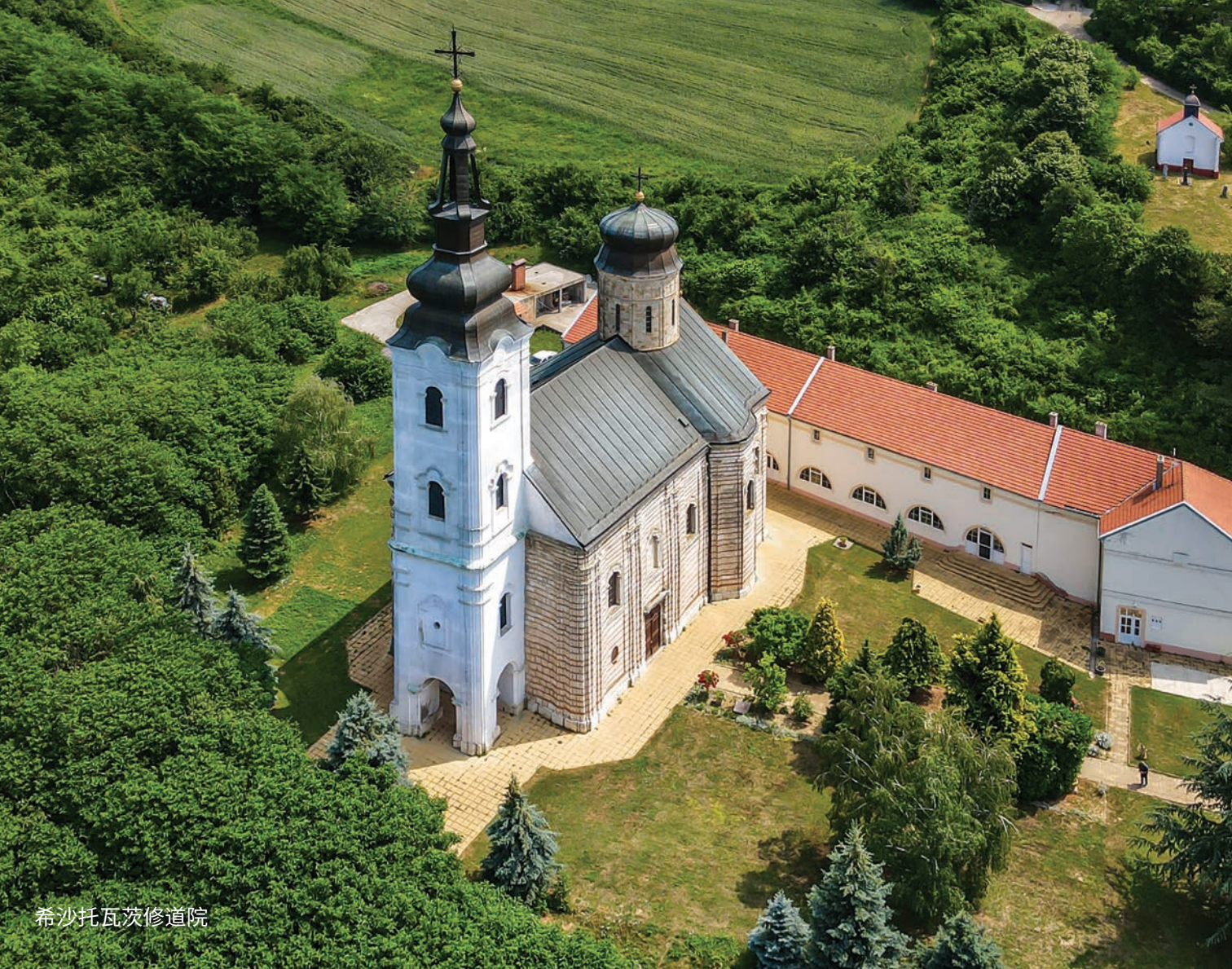
希沙托瓦茨修道院