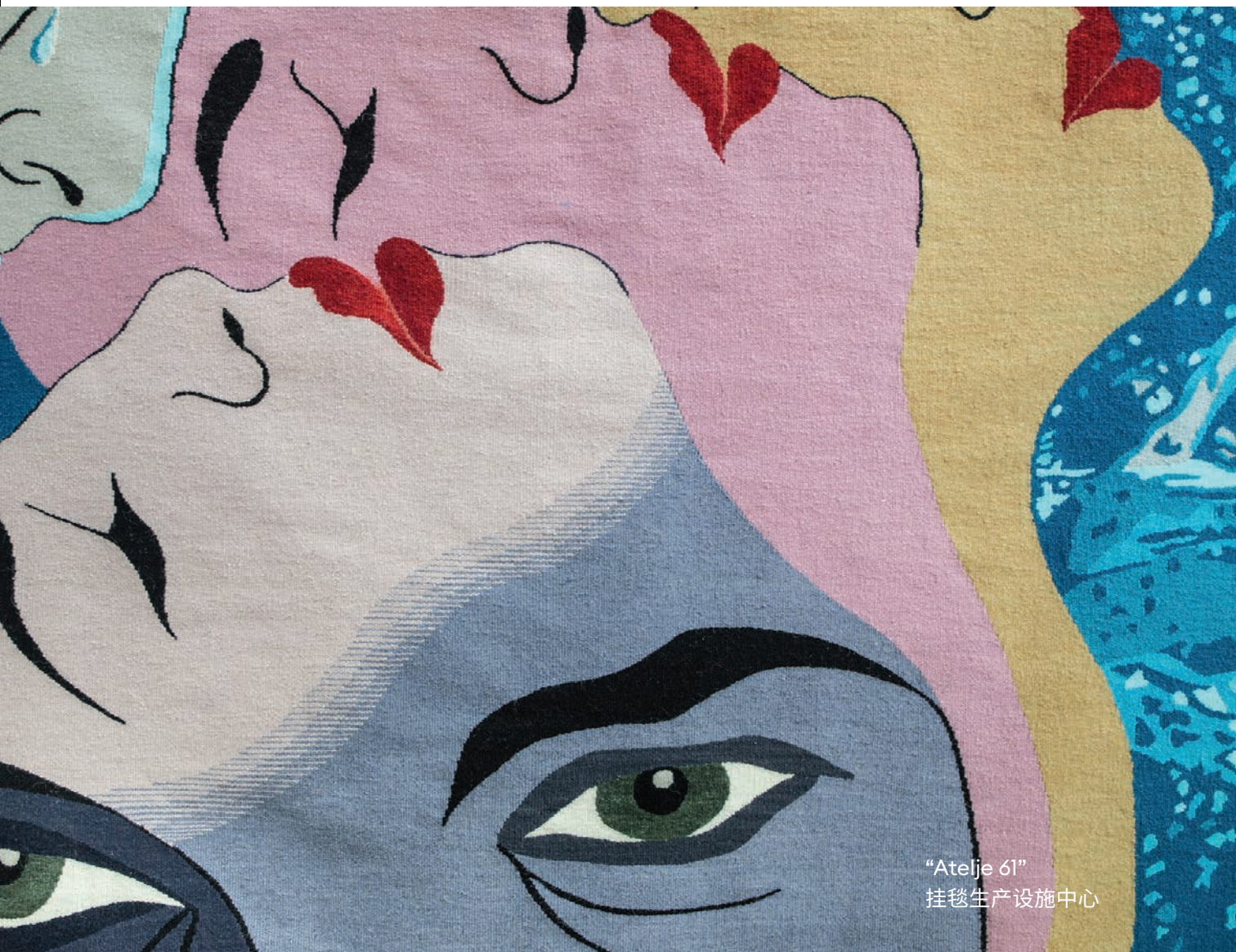
“Atelje 61” 挂毯生产设施中心

市的文化内涵。其中，Matica Srpska 画廊收藏了从16世纪至21世纪期间创作的艺术作品，是塞尔维亚最富有的艺术博物馆之一。为参观者提供了多种艺术欣赏方式，如展览的专家解读、讲座、艺术出版物的推介、艺术电影的放映、与艺术家的对话以及针对婴儿、儿童和青少年的工作坊。废弃的工业区因现代创意的努力而焕发出新的活力，机器的声音被诺维萨德艺术家的灵感所取代，而旧工厂变也被他们变成了创意园。