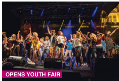
OPENS YOUTH FAIR