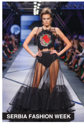
SERBIA FASHION WEEK