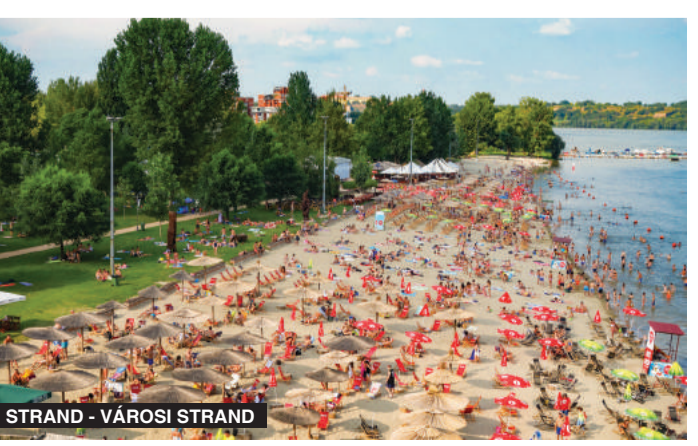
STRAND - VÁROSI STRAND