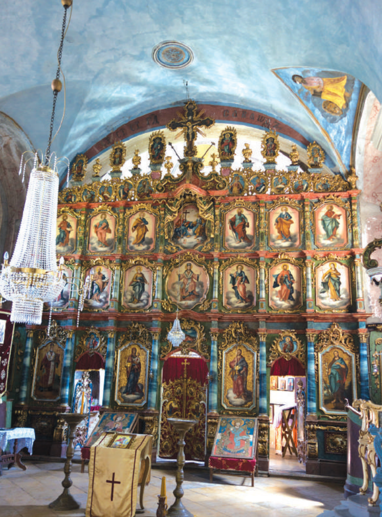
Иконостас церкви в Нештине